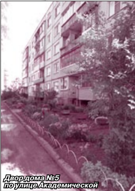
Двор дома №5 по улице Академической