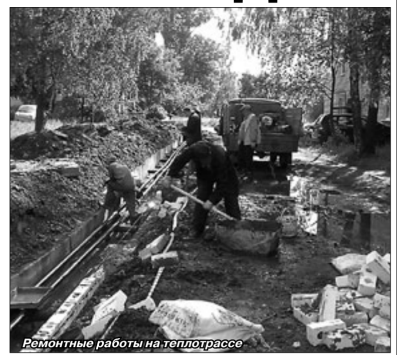
Ремонтные работы на теплотрассе

мая была прекращена подача артезианской воды населению, учреждениям, предприятиям. За это время была выполнена большая работа в котельной поселка Редкино, а также проведены работы по устранению аварийных ситуаций в тепловых сетях и на основном водопроводе, снабжающем водой Редкино. В настоящее время ведется капитальный ремонт теплотрассы на ул. Геофизиков к домам № 5 и № 9, ул. Диева от д.7 до д.9, далее будет проводиться капитальный ремонт теплотрассы ул.Фадеева, д.10, ул.Парковая, 43. Просим жителей поселка Редкино отнестись с пониманием к созданным неудобствам. Работники ОАО «ЖКХ Редкино» приложат все силы для качественной подготовки инженерных сетей к новому отопительному сезону 2012-2013 г. Администрация ОАО «ЖКХ-Редкино»