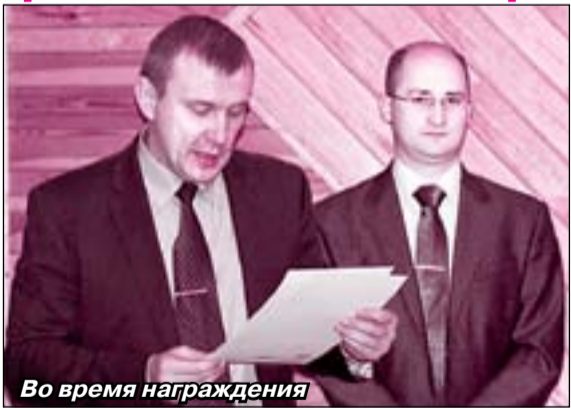
Во время награждения

В НЫНЕШНЕМ году впервые за многие десятилетия профессиональный милицкий праздник, который традиционно отмечается 10 ноября, официально стал именоваться несколько иначе – «День сотрудников органов внутренних дел». Впрочем, перемена названия, как говорится, сути не меняет. И люди, охраняющие наш покой и порядок в поселке, остались те же.